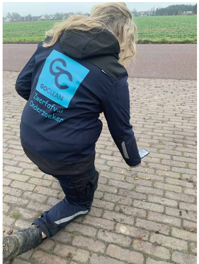
GoClean onderzoekt zwerfafval.

"Zo kunnen we specifiek de vervuilingsgraad in bepaalde gebieden in bepaalde periodes tonen. Recent hebben we zo'n monitoring uitgevoerd in de binnenstad van Nijmegen en langs de A325 tussen Arnhem en Nijmegen. In een periode van vijf weken worden gebieden wekelijks opgeschoond, zodat je tot in detail per gebied in de binnenstad kunt aangeven wat er ligt, hoe snel vervuiling plaatsvindt en van welk type afval of merk." ↩