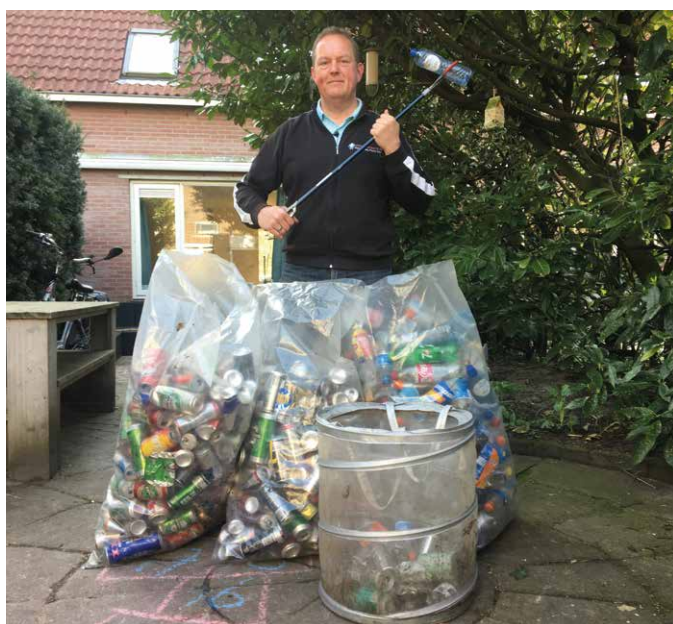
Zwerfinator met buit waarvan de opbrengst naar Giro 555 ging.

Valstar houdt zich momenteel onder meer bezig met de implementatie van de Europese richtlijn SUP (single use plastic, zie kader, red.), vooral het onderdeel van de UPV: zowel opruimkosten als bewustwordingsmaatregelen. Zo komt er dit jaar voor het eerst sinds lange tijd een publiekscampagne in het kader van zwerfafval. "De SUP is het afgelopen jaar vertaald in Nederlandse wetgeving. Daarin is onder andere vastgelegd dat voortaan het schildpadlogo op sigarettenpakjes moet staan, om aan te geven dat peuken filters met plastic bevatten. De meeste mensen denken dat ze alleen papier weggooien. Het onderdeel reductie maatregelen en UPV is verder uitgewerkt in een ministeriele regeling die in oktober-december 2021 in internetconsultatie lag (zie ook kader, red.)."